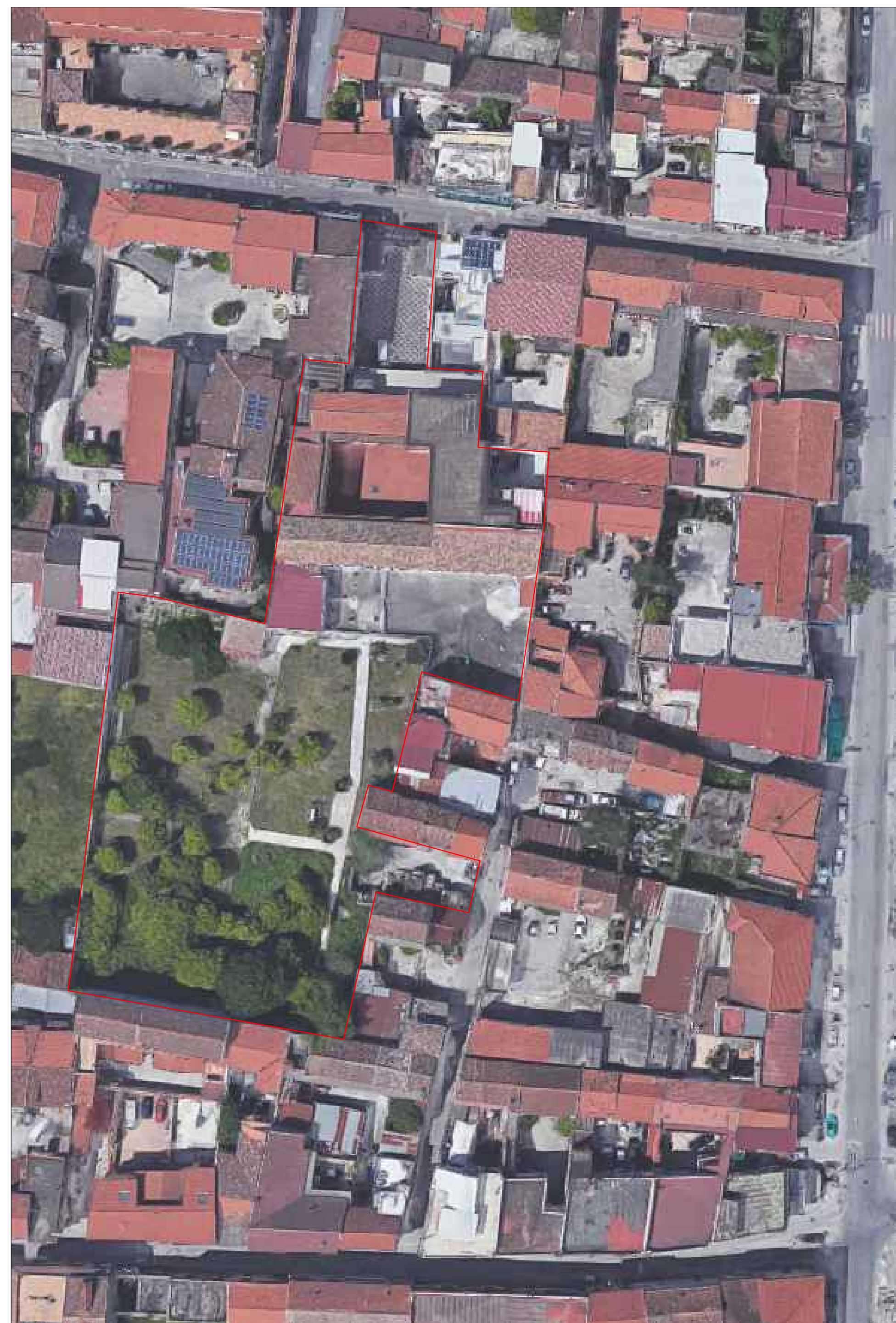
COMUNE DI SAN MARCELLINO N. 0018050 - SERVIZIO DEL 06-12-2022 STRALCIO PIANO DI RECUPERO